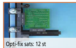
Opti-fix sats: 12 st